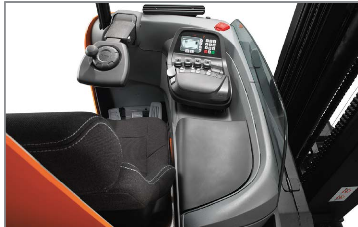
Эргономичная кабина для максимально удобной работы