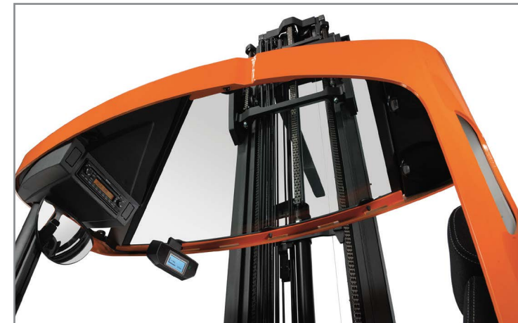
Прозрачная крыша обеспечивает контроль груза на высоте