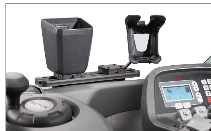
Крепление для вспомогательных устройств (опция)