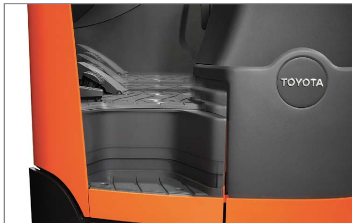
Регулировка уровня пола кабины